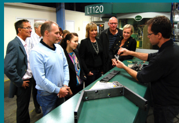
Besök hos Tre D i Vilshult.

Fler liknande insatser kommer att göras innan projektet är slut.